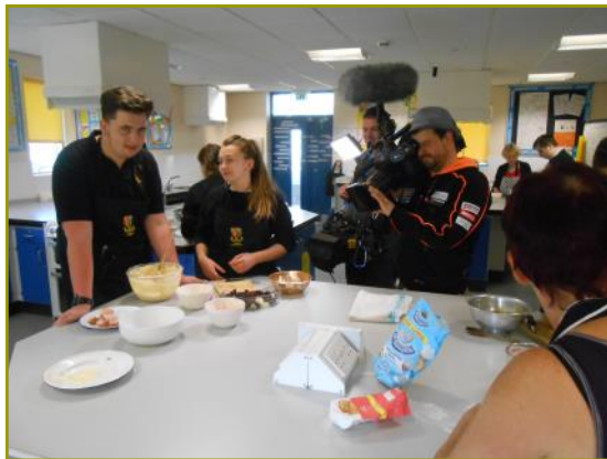
S4C yn ffilmio'r dosbarth Arlwyio